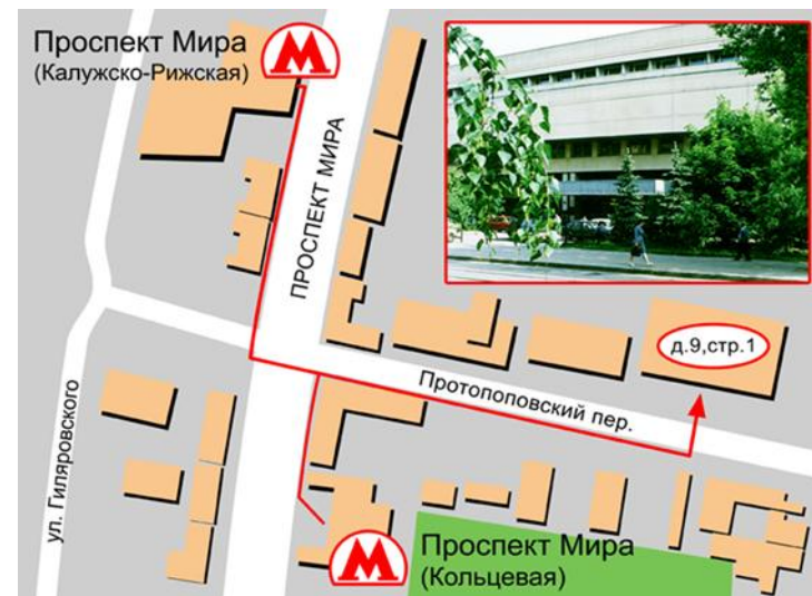
Схема проезда в Академию